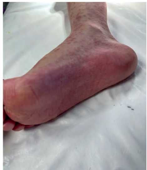
Острая РТПХ кожной формы Acute cutaneous GVHD