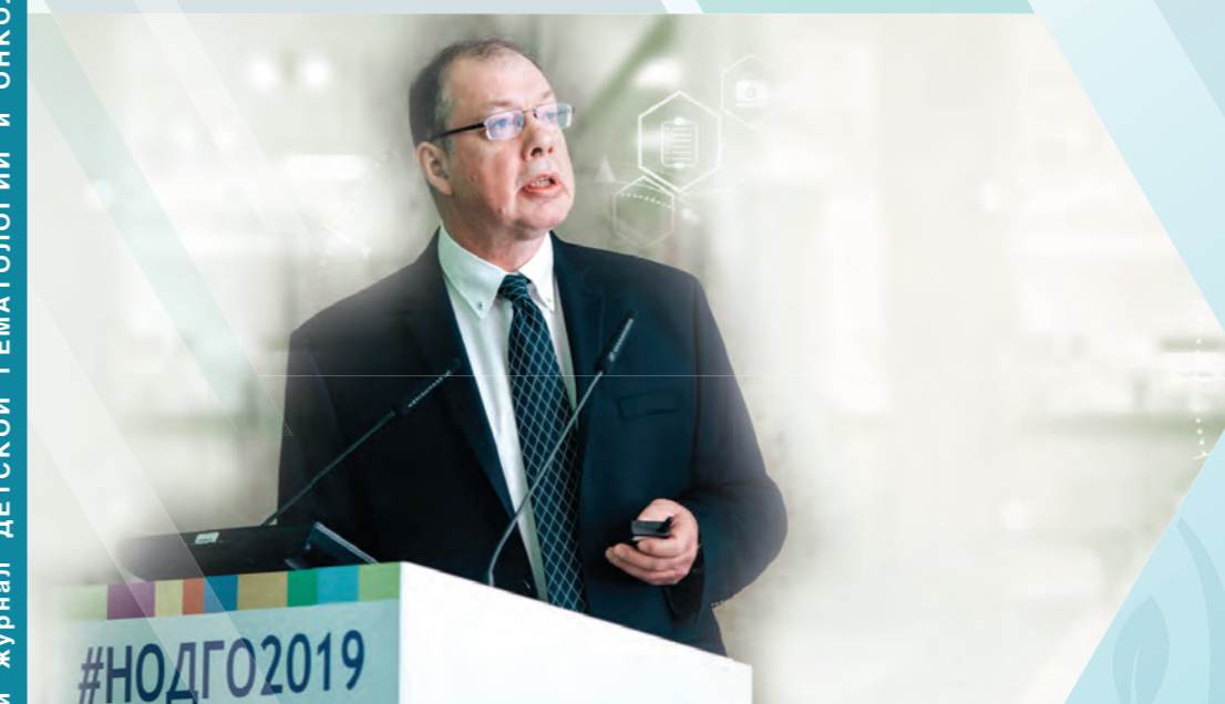
Фото к материалу из рубрики «Новости нашего сообщества»

Российский журнал ДЕТСКОЙ ГЕМАТОЛОГИИ и ОНКОЛОГИИ